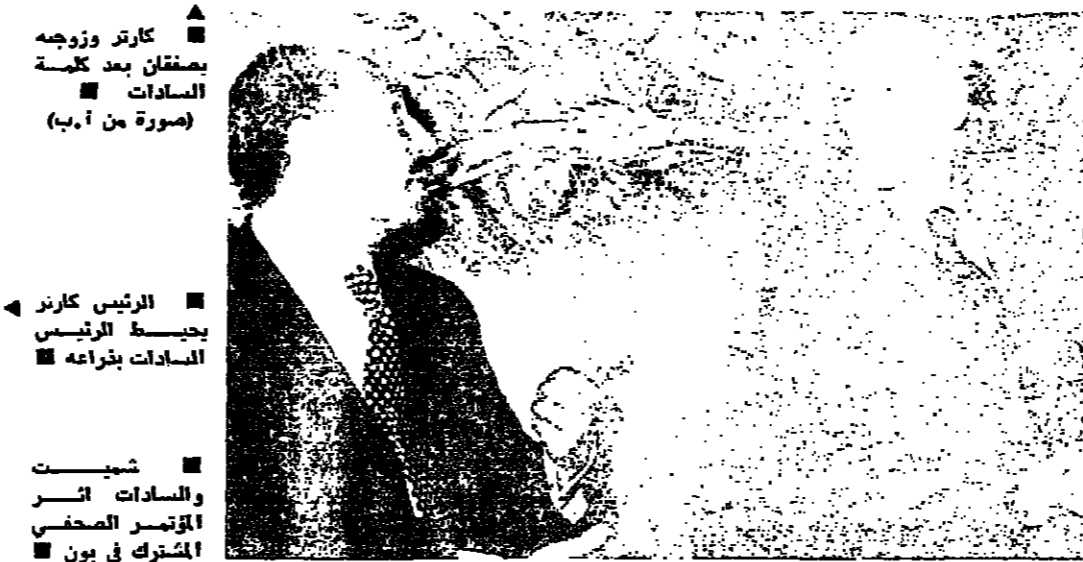
■ الرئيس كارتر بجسطة الرئيس السيدات بفرامه